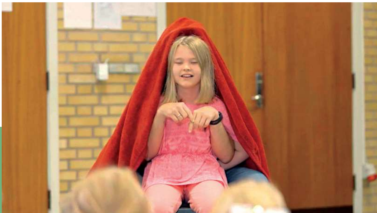
HER ET EKSEMPEL PÅ EN AKTIVITET, HVOR PIGEN "LÅNER" EN ANDENS HÆNDER.

Jeg har bestræbt mig på efter bedste evne at give inspiration, viden, erfaring og indsigt videre. Jeg har dog i mange, mange år haft psykologen Edgar Rubins kloge ord i baghovedet: "Gud fri mig for nogensinde at danne skole. Det eneste, man kan være sikker på, hvis man danner skole, er, at ens fejltagelser føres videre gennem generationer."