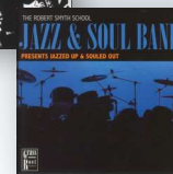
Robert Smyth Academy Jazz Band og Soul Band har indspillet 3 cd'er

basale instrumentale færdigheder, lavede vi forskellige instrumentforløb. Vi lavede først et keyboardforløb i seks uger, hvor hele klassen lærte at spille keyboard. Derefter lærte de basguitar og trommer baseret på 12-takters blues, og til sidst havde de samspil, hvor de i grupper af 4-5 elever fik hver sit øvelokale. I England er det almindeligt at undervise i temaforløb, og i musik er der stort fokus på verdensmusik, måske fordi England er så multikulturel. Verdensmusik er en del af pensummet på alle trin, bl.a. indisk og afrikansk musik. Eleverne blev desuden undervist i musikteori, nodelære og komposition, hvor vi brugte programmerne Sibelius og Cubase.