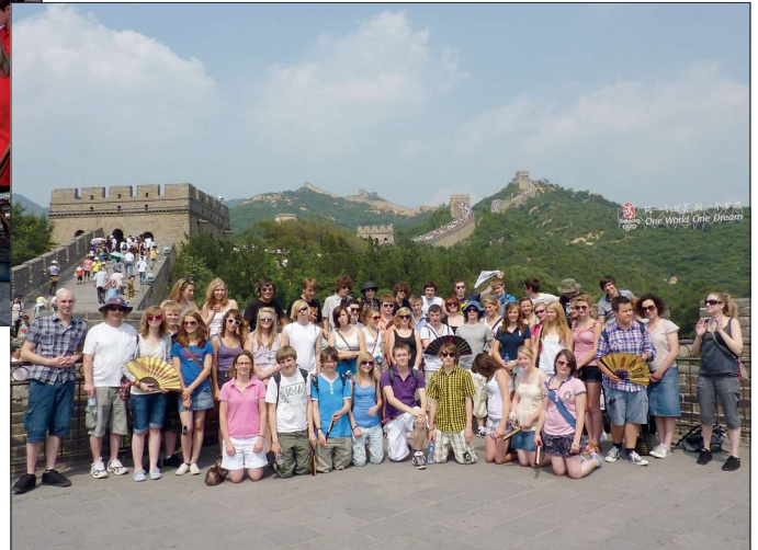
Robert Smyth Academy, Tourné Kina 2010 i forbindelse med ISME verdenskonference

Eleverne fik lov til at gå fra de andre undervisningstimer for at få soloundervisning; det er jo en anerkendelse af musikkens betydning og status.