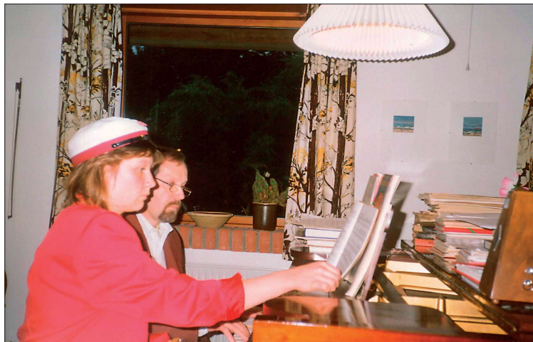
Student ved klaveret 1991

☘ Nogle primary schools har dygtige musiklærere, men på andre skoler er der ingen lærere, der kan spille guitar eller klaver.