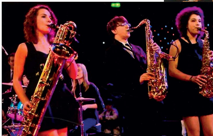
School Proms Royal Albert Hall 2011. Soul Patrol fra Robert Smyth Academy var udvalgt blandt 1600 orkestre i England. Der var 5000 tilskuere