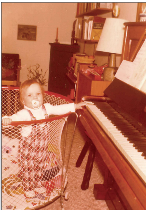
Helles første toner på klaver som etårig, 1973