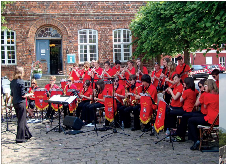
Robert Smyth Academy spiller i Ribe 2009