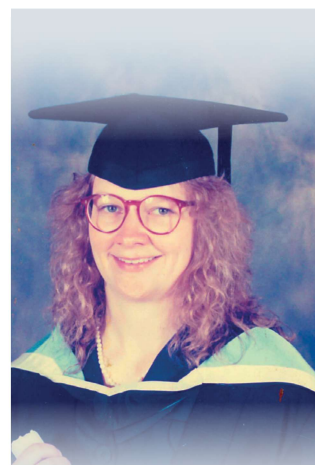
Bachelor of Arts in Music Graduation 1994

Det kræver en universitetsuddannelse, hvis man skal undervise i folkeskolen. Der er to forskellige uddannelser for at kunne undervise som lærer i henholdsvis primary og secondary school . Hvis