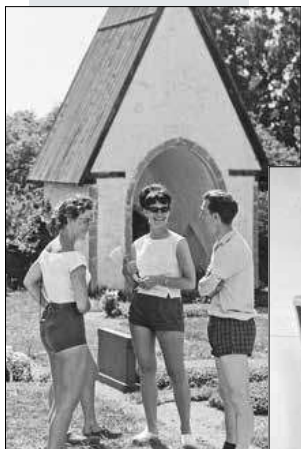
Ritt på seminarietur til Gotland