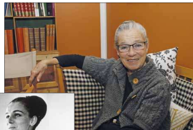
Ritt med FØR REGNING, som sammen med FØR DANSK var et banebrydende undervisningsmateriale på tidspunktet og en stor succes i ca. 20 år.