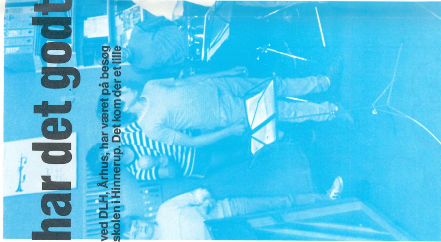
Generelt skal læreren være lydhør for elevernes ønsker, og studeringen af »We are the world«.

– Først og fremmest har vi været meget heldige, for det vi laver, kan sagtens laves andre steder.