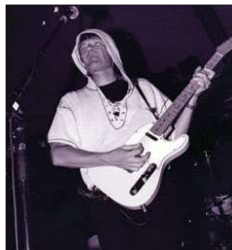
Lars Lilholt med hættetrøje 1996