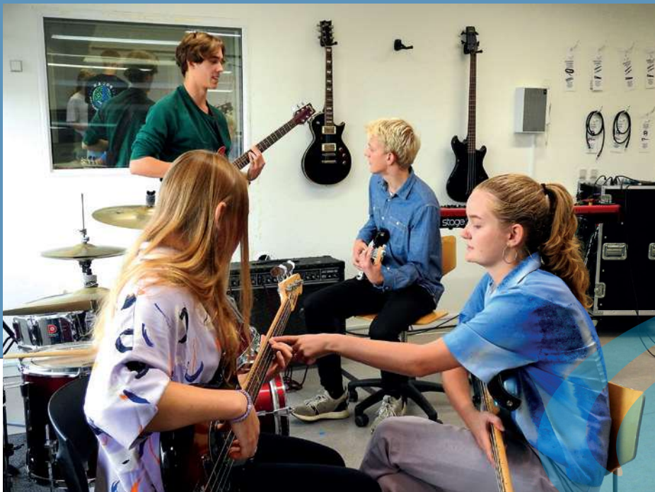
3.G-ELEVER UNDERVISER 1.G-ELEVER

eksempel deltager Favrskov Kommune i den landsdækkende "Spil Dansk-uge", hvor både musikskolen og vi via kommunens Kulturelt Samvirke får mulighed for at afholde arrangementer, som er særligt henvendt til unge. Her inviterer vi hinandens elever til vores arrangementer, så musikskolens ældste elever medvirker i gymnasiets workshops, mens gymnasiets elever deltager i musikskolens arrangementer. Det resulterer i, at musikskolens elever deltager i arrangementer hos os på Favrskov Gymnasium, ligesom vores elever deltager på musikskolen. Det er guld værd, at vi som gymnasium kan åbne op over for lokalsamfundet, fordi musik som undervisningsfag let kan risikere at gå hen og være et lukket rum. For eksempel inviterer vi også musikskolens ældste elever og Hadsten Skoles ældste klasser til vores musicals og sørger på den måde for, at Favrskov Gymnasium sætter sig spor hos dem og er det første og naturlige valg, når de engang skal vælge gymnasium.