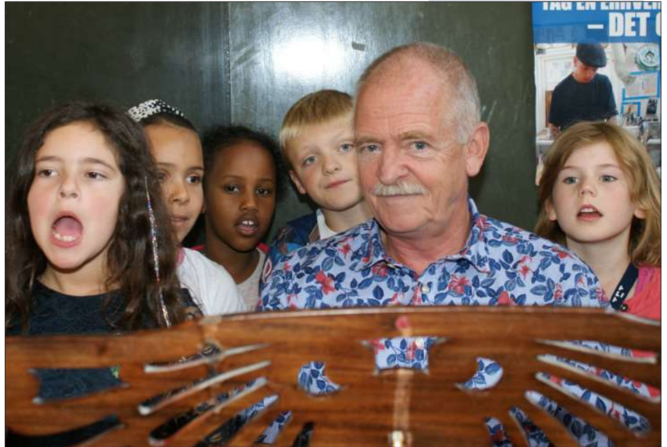
Ole spiller med 1. klasse

Jeg kan ikke sige, at musikken redder dem alle, men i enkeltstående tilfælde kan musikken gøre en forskel.