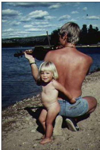
Camping i Värmland 1984